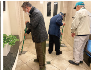
モップ掛けの体験

参加者からは「実際に体験してみると、思っていたのとは違いました」、「解説と実務研修の両面から学べて、自信をもって就業できます」との感想が寄せられました。